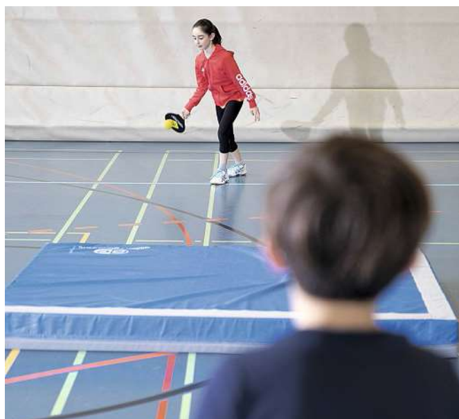
Erzeugt Spannung und weckt den Spieltrieb: «Around the World» – ein Klassiker, der beliebig variiert und im Schwierigkeitsgrad erweitert werden kann.