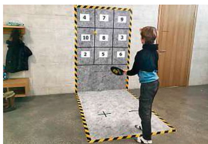
Kopfrechnen mit Racket und Ball.

www.streetracket.com www.schulentwicklung.ch