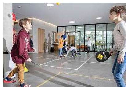
Zwei Schüler üben mittels Ballspiel die Reihen.