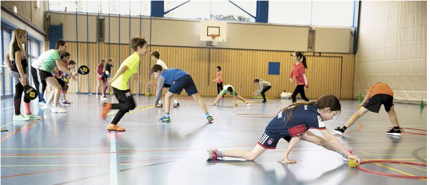
«Street Racket» stärkt die Hand-Augen-Koordination. In eine Stafettenform verpackt ist Spiel, Bewegungstraining und Wettkampf in einem angesagt.

tische vorhanden waren», erzählt Gründer Straub mit einem amüsierten Lächeln im Gesicht. «Unverrichteter Dinge wieder umzukehren, kam nicht in Frage. Wir zeichneten die Tischtennistische deshalb auf den Boden.» Das war die Geburtsstunde von Street Racket.