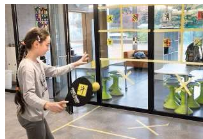
Street Racket kann auch im Unterricht für das bewegte Lernen genutzt werden.