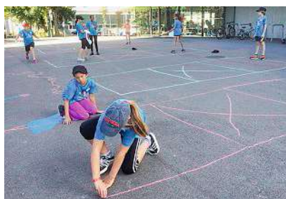
Schläger, Ball und Kreide – es kann losgehen.